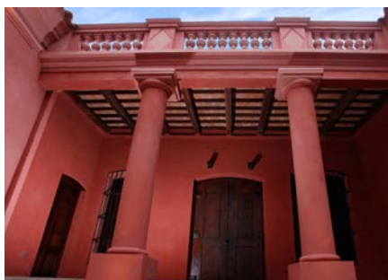
Museo Casa de Güemes

Lleva el nombre en conmemoración al día de la independencia argentina y es el sitio fundacional de la ciudad. Es el centro político, social y comercial de la ciudad de Salta. Cuenta con más de 250 ejemplares de distintas especies arbóreas. Alrededor de ella se encuentra la Catedral de Salta, el Cabildo de Salta, el MAAM., el Centro Cultural América y el Teatro Provincial.