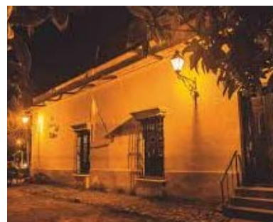
Peña La Casona del Molino

Un recorrido por los hitos de la vida de Gral. Martín Miguel de Güemes y de las guerras por la independencia. En las salas, patios y galerías, uno se remonta a los primeros años de vida de Güemes, su desempeño del entonces joven Martín Miguel en la defensa durante las invasiones inglesas, la guerra gaucha, el trabajo como gobernador de Salta, entre otros acontecimientos históricos.