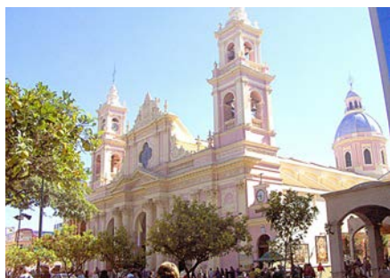
Plaza 9 de Julio

Lleva el nombre en conmemoración al día de la independencia argentina y es el sitio fundacional de la ciudad. Es el centro político, social y comercial de la ciudad de Salta. Cuenta con más de 250 ejemplares de distintas especies arbóreas. Alrededor de ella se encuentra la Catedral de Salta, el Cabildo de Salta, el MAAM., el Centro Cultural América y el Teatro Provincial.